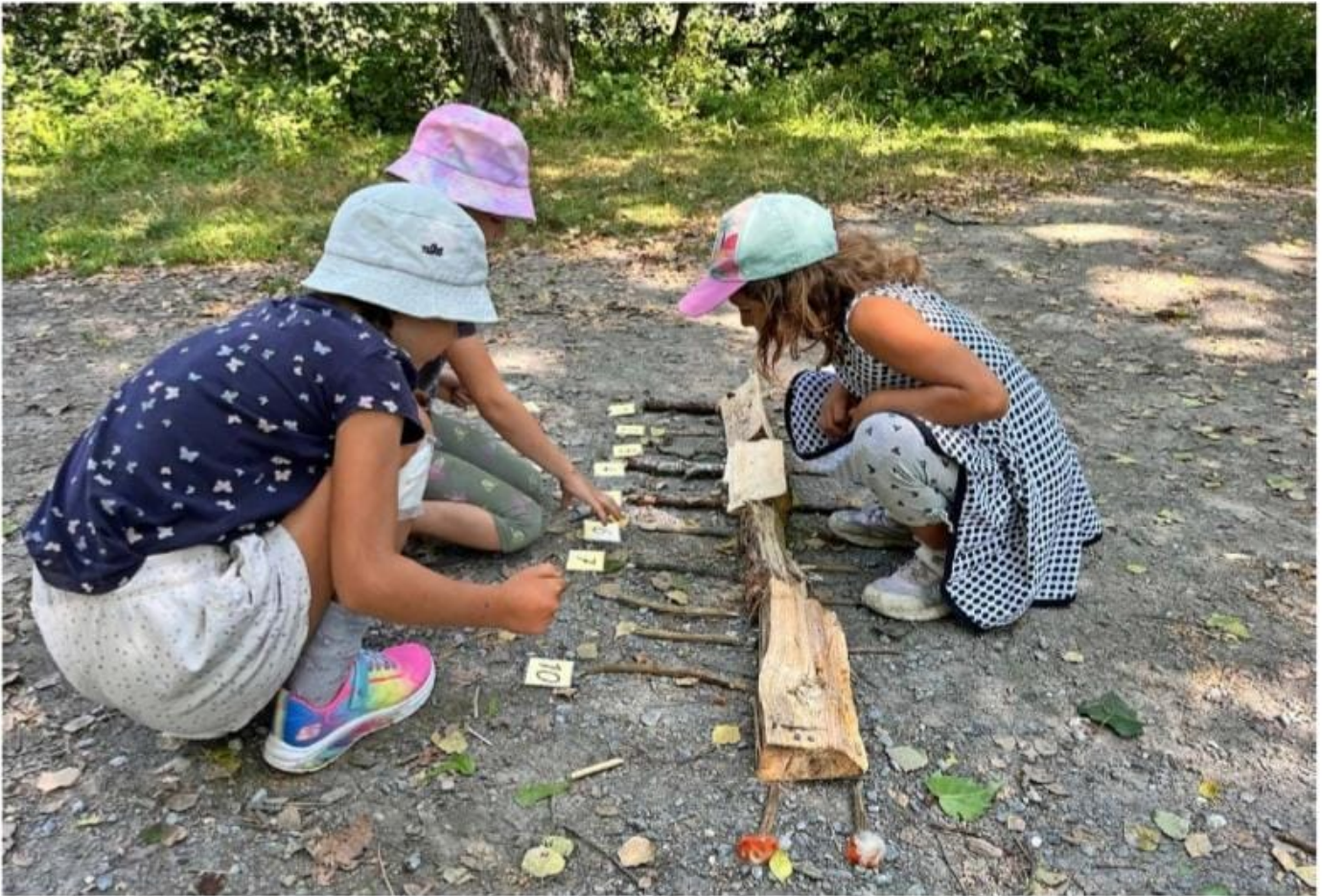
Die Kinder lernen spielerisch in der Natur.