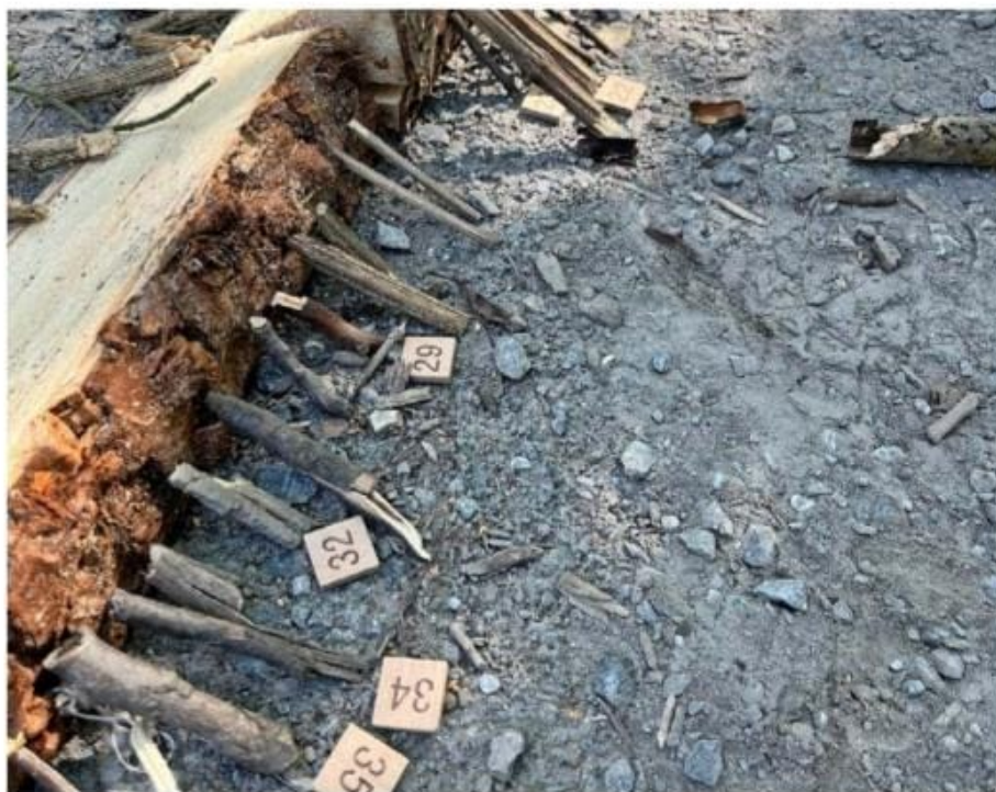
Das Mathematikprogramm war, einen Tausendfüssler zusammenzubauen.