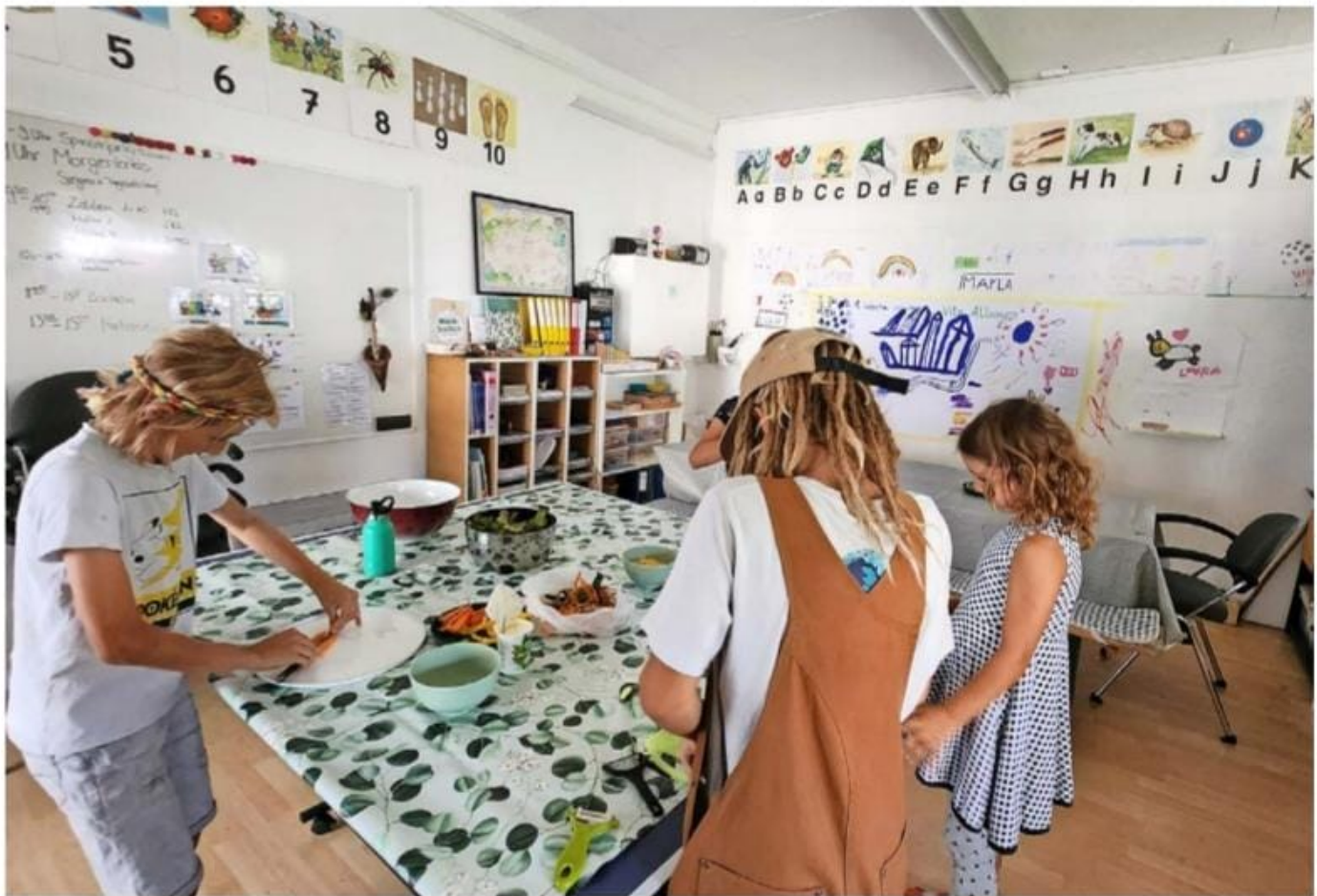
Im Klassenzimmer wird auch gemeinsam gekocht.